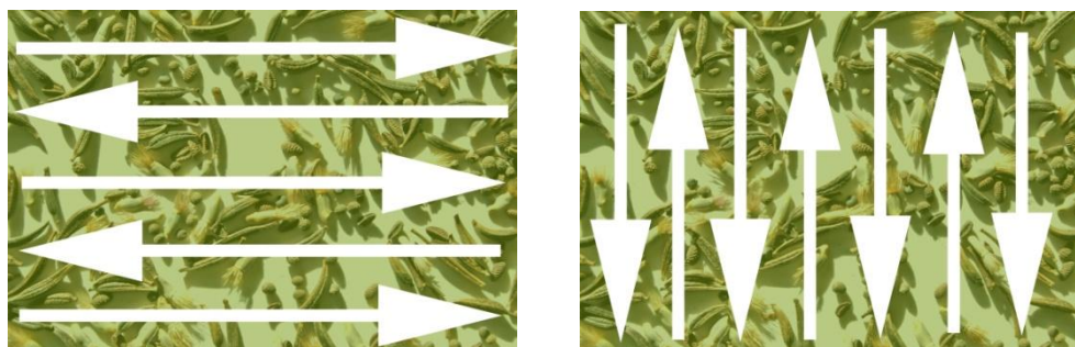
Figure 2. Schéma d'application des semences en deux étapes.

Pour assurer une distribution uniforme des semences, diviser la quantité du mélange de semences en deux. Si le site a été marqué en plusieurs sections, diviser aussi les semences pour chacune des sections en deux. Semer la première moitié du mélange en parcourant le site ou la section dans un sens seulement, par exemple d'est en ouest. Semer ensuite la seconde moitié du mélange en parcourant le site ou la section perpendiculairement au premier parcours, par exemple du nord au sud (voir figure 2.). Il faut garder à l'esprit que les semences doivent être distribuées uniformément sur l'ensemble du site. Normalement, la quantité de semences apportées sur le site devrait avoir été calculée au préalable et correspondre aux besoins du site. Il faut donc doser l'épandage des semences en conséquence.